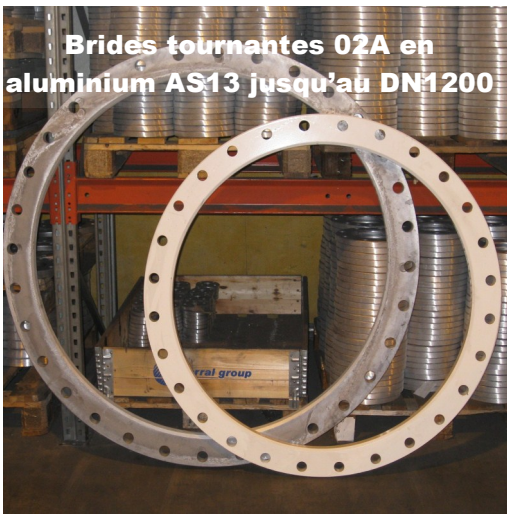
Brides tournantes 02A en aluminium AS13 jusqu'au DN1200

une corrosion ambiante importante. Les deux revêtements les plus courants sont la peinture Epoxy cuite au four et la Rilsanisation encore plus résistante aux chocs ou au serrage des boulons.